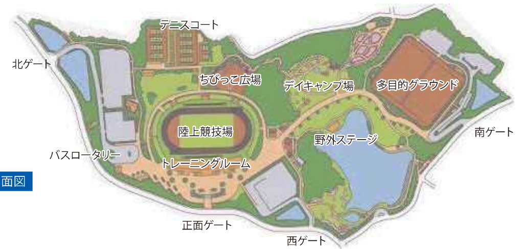
半田運動公園施設平面図