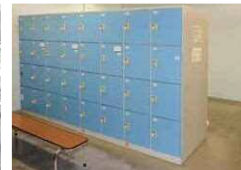
ロッカールーム ロッカールーム4箇所(各室ロッカー100個)、シャワールーム4箇所(各室シャワー4基)があります。