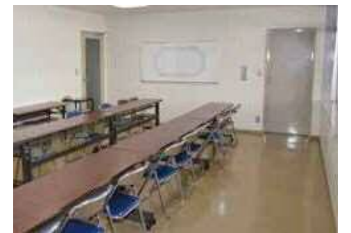
ミーティングルーム 医務室、ミーティングルームが2室32.64㎡(4.8m×6.8m)があります。