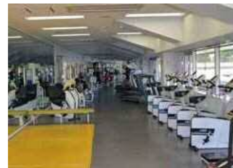
トレーニングルーム 本格的なトレーニング機器が23種40台あります。