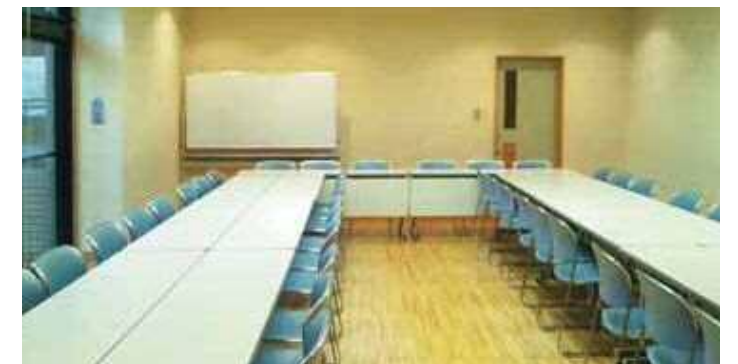
第二会議室 洋室タイプ45㎡(椅子42脚・湯沸付)