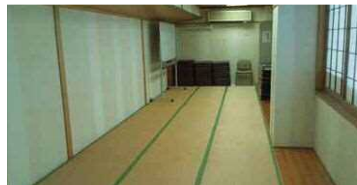
第三会議室 和室タイプ36㎡(18畳、湯沸付)