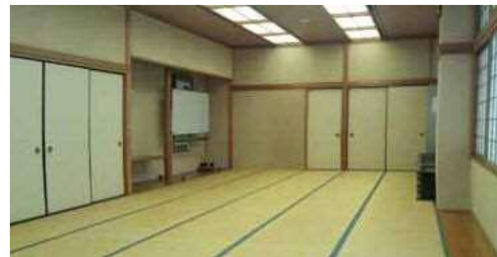
第一会議室 和室タイプ72㎡(30畳、湯沸付)