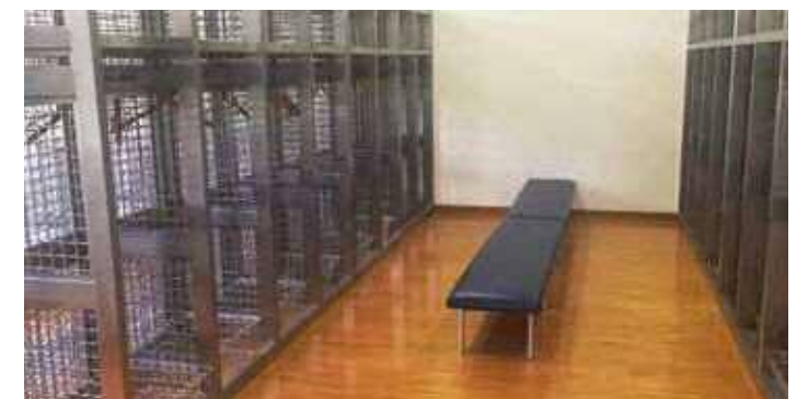
更衣室 シャワールームを有した更衣室が男女各1室あります。男子更衣室(ロッカー23個、シャワー6基)、女子更衣室(ロッカー8個、シャワー3基)。