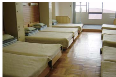
宿泊施設 全室オーシャンビューで最大500名が宿泊できます。