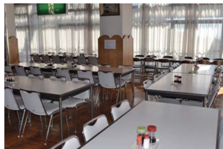
食堂 和洋バイキング料理を提供します。