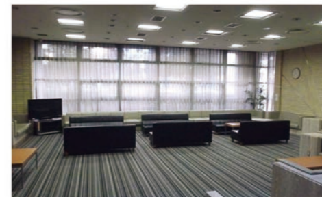
ロビー ミーティングスペース有