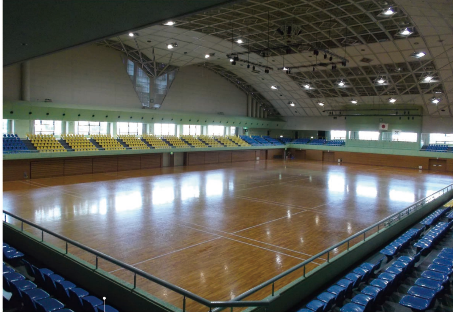
第1競技場 広さ 3,450 m 2

・延床面積3,450㎡(約76m×約45m)。天井高21.3m。 ・バレーボール4面、バスケットボール4面、卓球36台、テニス4面、ハンドボール3面、バドミントン16面設置可 ・観覧席収容人員：1階可動席1,000席、2階固定席2,000席、身障者席5名