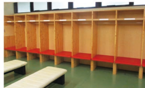
更衣室(男女各2室)・ロッカー計30個(男女各15個) ・シャワー計10基(男女各5基)