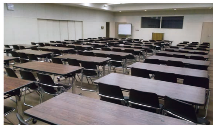
研修室 (202m 2 ) スクリーン、放送設備有