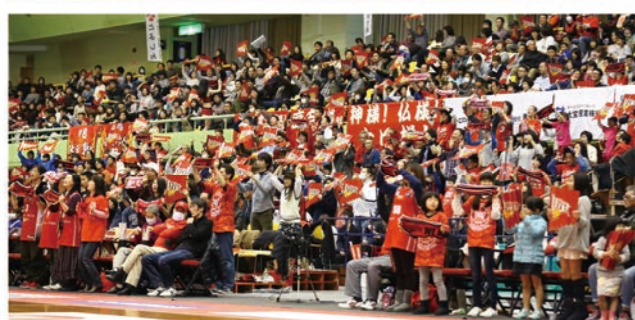
第2競技場 広さ 1,178 m 2

・延床面積1,178㎡(約36m×約32m)。天井高13.5m。 ・バレーボール2面、バスケットボール2面、バドミントン6面、卓球台16台設置可