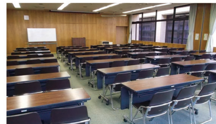
第1会議室 (160m 2 )・第2会議室 (115m 2 ) スクリーン、放送設備有