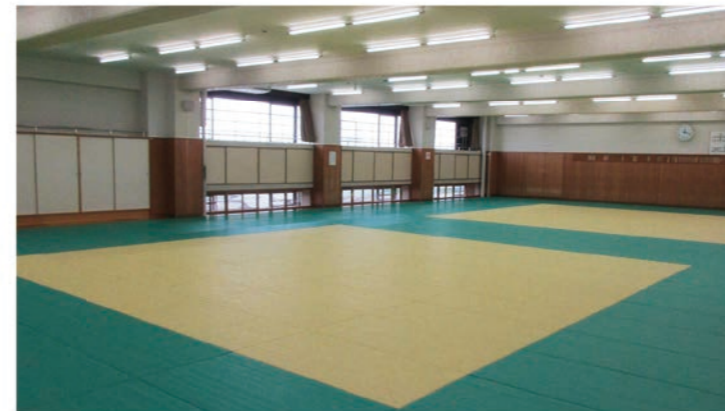
柔道場 ・面積493㎡、2面設置。 ・国際規格の畳を常設。