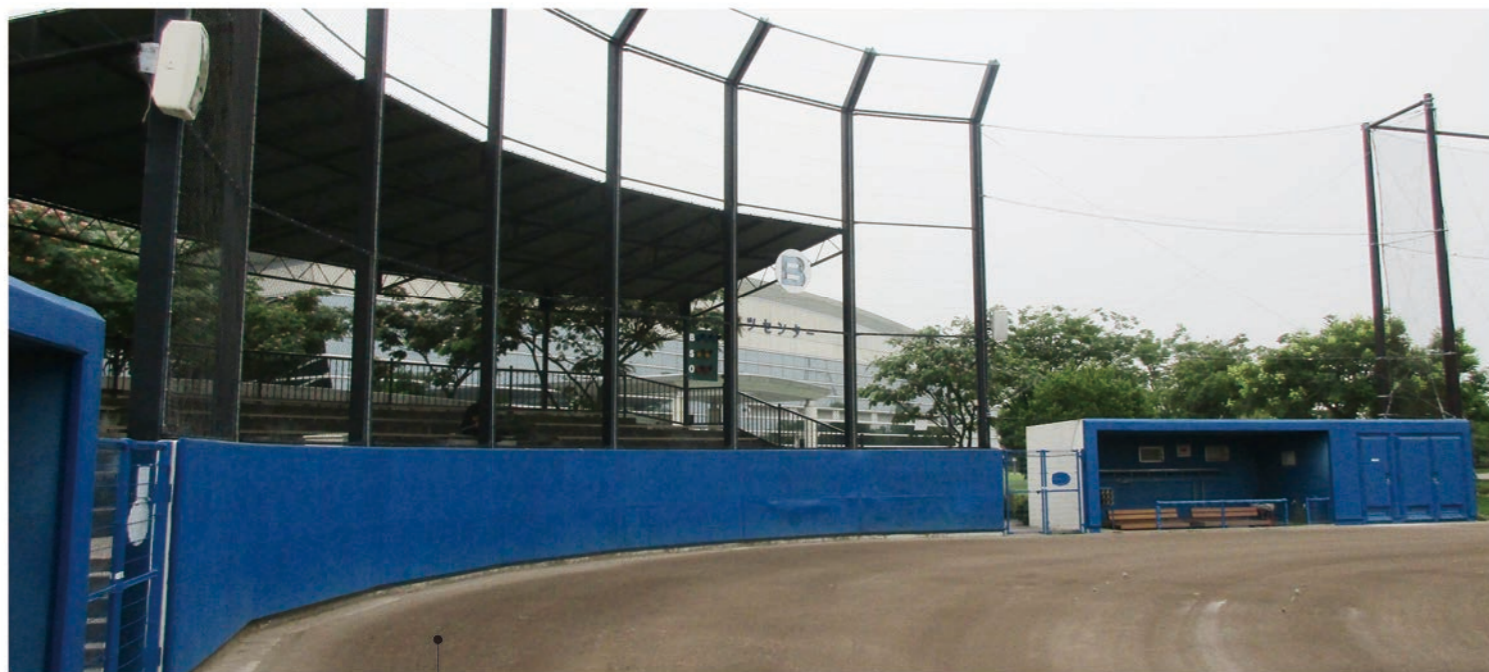
ソフトボール場 B 広さ 7,130㎡ ・グラウンド面積 7,130㎡、両翼 70m。 ・観覧席 2,000席(バックネット裏座席140席、芝生席1,860席)。