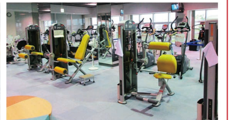
トレーニングルーム 26種56台の機器を配備。