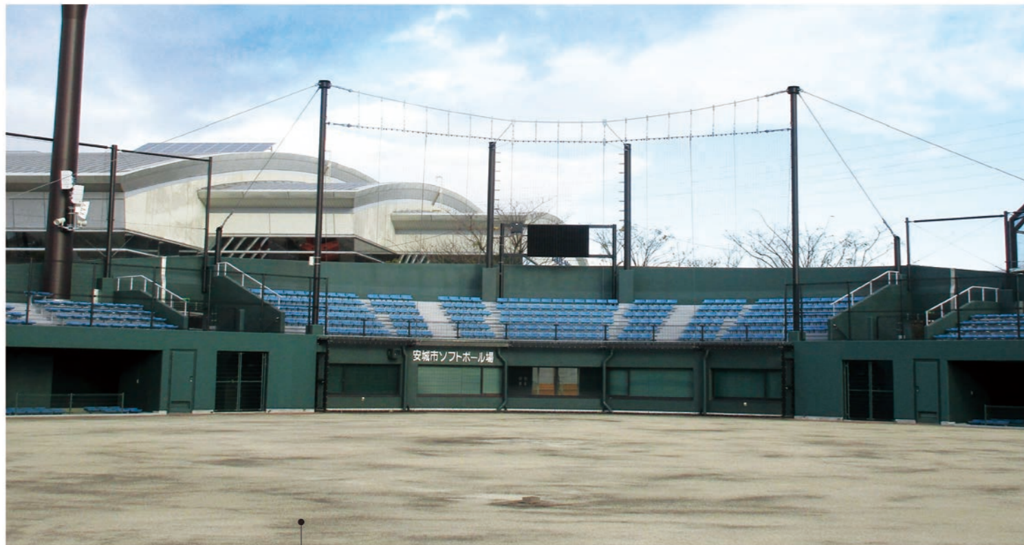
ソフトボール場 A 広さ 7,130㎡ ・グラウンド面積 7,130㎡、両翼 70m。 ・電光掲示板、本部席あり。夜間照明(照明塔 4基)。 ・観覧席 2,500席(スタンド座席1,000席、芝生席1,500席)。