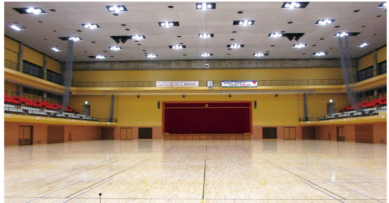
メインアリーナ 広さ 1,980㎡ ・延床面積1,980㎡(50m×38m)、天井高14m。 ・バドミントン12面、バスケットボール3面、バレーボール3面設置可。