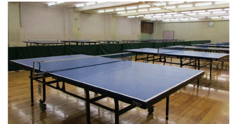
卓球場 ・面積493㎡、16面設置。 ・ITTF仕様の卓球台、ネットを完備。