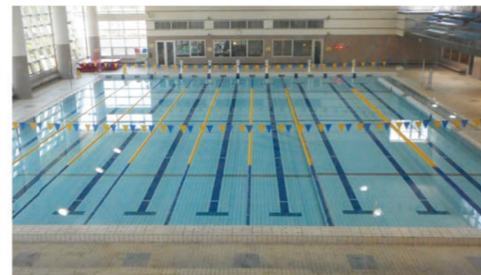
温水プール 25m・9コース(短水路公認)。

ソフトボール場から徒歩1分、体育館から徒歩2分。 温水プール、トレーニングルームなどを備えています。