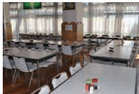
食堂 和洋バイキング料理を提供します。