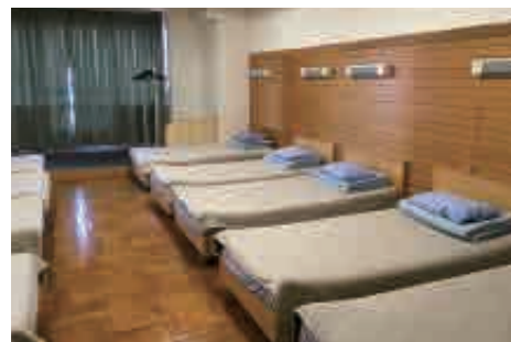
宿泊施設 全室オーシャンビューで最大 500 名が宿泊できます。